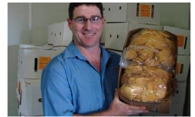
Un importateur vérifie la qualité

Les importateurs et les entreprises de conditionnement achètent et/ou font le négoce de fruits séchés. Il existe des entreprises de conditionnement hautement spécialisées, telle que Seeberger en Allemagne, Haagland en Belgique, Intersnack, Doens en van Rhumveld aux Pays-Bas, spécialisées dans les fruits séchés et les noix comestibles. Pour d'autres entreprises, le fruit séché est une activité annexe qui vient en complément d'un large assortiment d'autres produits alimentaires (conserves, boissons). Elles fournissent les entreprises agroalimentaires, les supermarchés et les grossistes. Les grands importateurs français incluent Bush & Vergez (marque Brover) ou Navimpex (marque Fruits & Roots).