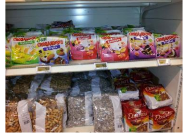
Mangues en mélange avec d'autres fruits

Si vous ciblez les entreprises agroalimentaires, il faut savoir qu'elles cherchent de plus en plus à travailler en direct avec les exportateurs des pays en développement pour obtenir un meilleur prix et s'assurer des approvisionnements réguliers.