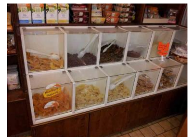
Mangues séchées en vrac chez primeur

Les mangues séchées biologiques provenant du Burkina Faso sont principalement vendues dans des magasins ou petits supermarchés bio, par ex. Biocoop , Artisans du Monde . On peut également les trouver aux rayons alimentaires de chaînes de bien-être et nature, comme par ex. Nature ou des jardineries.